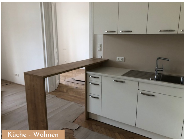
Küche - Wohnen